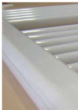
FINITURE IMPECCABILI ESTETICA DA PRIMATO