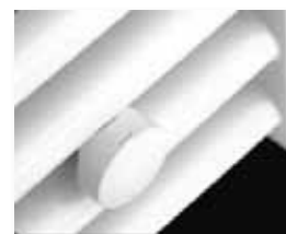
CON KIT DI FISSAGGIO MICROREGOLABILE GIÀ INCLUSO NELLA CONFEZIONE INSIEME ALLA VALVOLA SFILATO ARIA