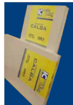
IN SCATOLA DI CARTONE IMBALLATO SINGOLARMENTE

Lo Scaldasalviette SLIM è lo scaldasalviette che coniuga la storica affidabilità tipica dei prodotti Ideal Clima alle più moderne tecnologie produttive. Ogni aspetto dei radiatori SLIM pone la qualità al primo posto. Ciascun tubo orizzontale, in acciaio al carbonio ad elevato spessore, viene prima "rivettato" all'interno del montante per una tenuta "a freddo".